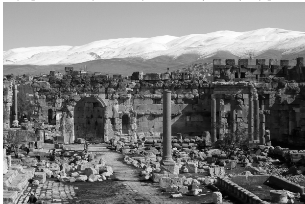
Hory Antilibanonu tvoria prirodzenú hranicu so Sýriou

V Libanone žijú aj nenároční drúzovia. Prehlásili, že oni nepotrebujú veľký Libanon, im stačí kúsok zeme, pohorie Šúf, v ktorom žijú. Sú prispôsobiví a verní každej vláde, ktorá je pri moci. Zjavne hrajú na všetky strany. Aj preto, lebo ich je veľmi málo – ani nie 10