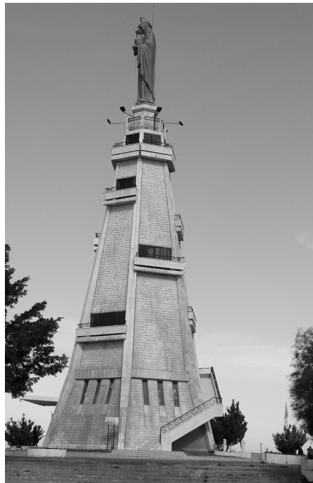
Libanonskí kresťania majú Pannu Máriu vo veľkej úcte. Celá krajina je doslova posiatá vysokými vežami s možnosťou výstupu nahor

Niekedy sa zdá, akoby do horských kresťanských oblastí Libanonu noha moslima