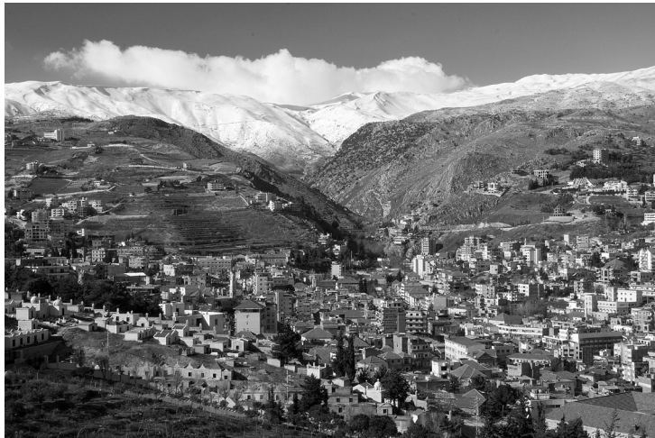
V Libanone terén prudko stúpa od mora k trojtisícovým vrcholom

Pred občianskou vojnou bol Libanon s množstvom významných svetových bánk, morom a nádhernými horami nazývaný Švajčiarskom Blízkeho Východu a bol vyhľadávaným miestom solventných turistov z celého sveta. Stačilo však, že moc v krajine sa dostala do rúk niekoľkých nepredvídavých a nezodpovedných politikov a pre mnohých obyvateľov krajiny,