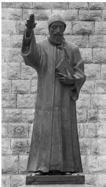
Cirkev každoročne slávi spomienku svätého Charbela 24. júla

a modlitbe. Zasiahnutý zákernou chorobou zomrel úplne vyčerpaný. Ľudia z okolia si všimli, ako z jeho hrobu vyčádzala žiara. Keď jeho hrob po niekoľkých mesiacoch otvorili, našli jeho telo neporušené, akým je až podnes.